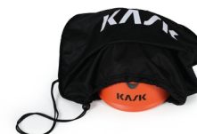
UAC00002 BOLSA PORTACASCO