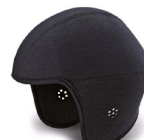
UPA00001 ACOLCHADO DE INVIERNO