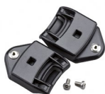
WAC00003 ADAPTADOR A BAYONETA