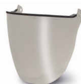
WV100003 PANTALLA COMPLETA