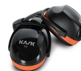
WHP00001 AURICULARES ANTIRUIDO