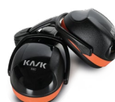
WHP00001 AURICULARES ANTIRUIDO