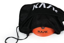
UAC00002 BOLSA PORTACASCO