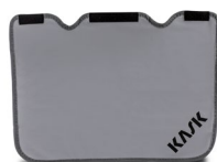
WAC00020 PROTECCIÓN DE CUELLO PARA PLASMA