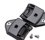
WAC00003 ADAPTADOR A BAYONETA